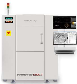
RAPIDER 130CT 小型基板検査