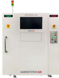
HAWKEYE 9020AXI 高速2D検査