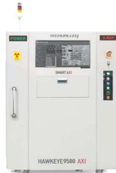
HAWKEYE 9500AXI 2.5D検査