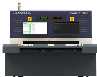
HAWKEYE 9000L LED、大型基板検査