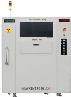
HAWKEYE 9010AXI 2D検査