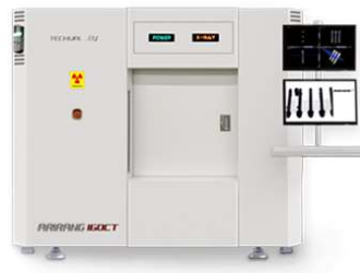
RAPIDER 160CT 車載部品等検査