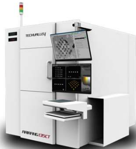
RAPIDER 135CT 大型基板検査