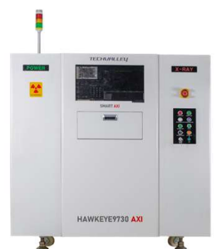
HAWKEYE 9730AXI 高精度3D CT検査