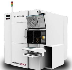
RAPIDER 165CT 半導体検査