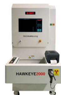
HAWKEYE 2000 X線チップ カンター