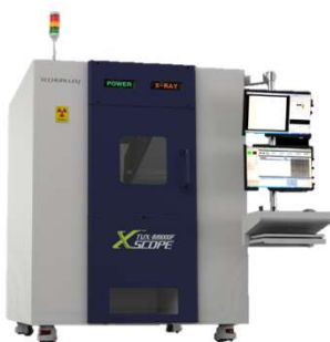
TVX IM9000F オンライン2D検査